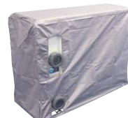
Bache d'hivernage avec orifice de passage pour les connexions