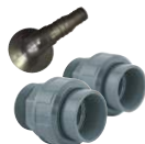
Raccords PVC Ø50mm 1½"