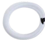
Tuyau d'évacuation des condensats